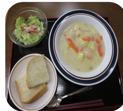
クリームシチュー